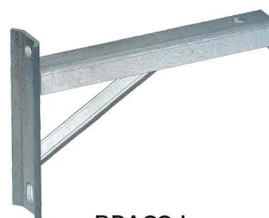
BRAÇO L "L" Bracket Braço Soporte "L"