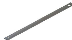
MÃO FRANCESA PLANA Flat Crossarm Brace Balancín Plano