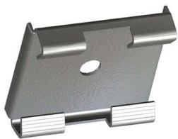
SELA CRUZETA Crossarm Reinforcing Plate Placa de Refuerzo para Cruceta