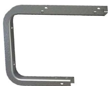
BRAÇO SUPOTE C "C" Bracket Brazo Soporte "C"