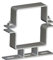
SUORTE PARA TRANSFORMADOR DT Transformer Mounting Bracket Soporte para Transformador