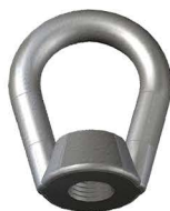
PORCA OLHAL Eye Nut Tuerca de Ojo