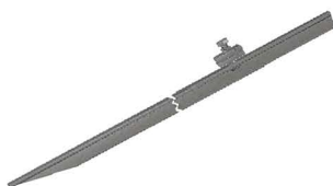
HASTE TERRA Ground Rod Varilla Tierra