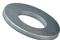
ARRUELA REDONDA Round Washer Arandela Redonda