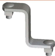
SUORTE Z "Z" Bracker Soporte "Z"