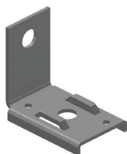
SUPOTE DM REFORÇADO Bracket DM Reinforced Soporte DM Reforzado