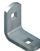
CANTONEIRA RETA Bracket Cantoneira