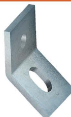
CHAPA ESTAI Guy Attachment Placa de Apoyo