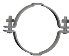
CINTA REDONDA Round Pole Band Abrazadera Redonda