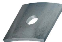
ARRUELA CURVA Curved Washer Arandela Curva