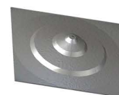
CHAPA ÂNCORA Cross Plate Anchor Plato de Anclaje