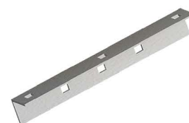
CANTONEIRA AUX BRAÇO C Auxiliary Crossarm for "C" Bracket Cantoneira de APOYO para Brazo "C"