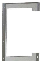
AFASTADOR DE ARMAÇÃO SECUNDÁRIA Secondary Rack Extension Afastador para Bastidor