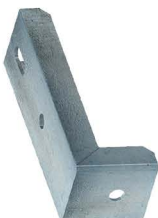
SUPOTE VERTICAL Pole Top Vertical Bracket Soporte Fijador Vertical