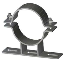
SUORTE PARA TRANSFORMADOR Transformer Mounting Bracet Soporte para Transformador