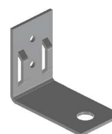
SUPOTE DM Bracket DM Soporte DM