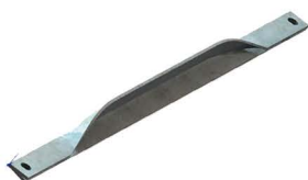
MÃO FRANCESA Side Arm Diagonal Brace Balancin Angular