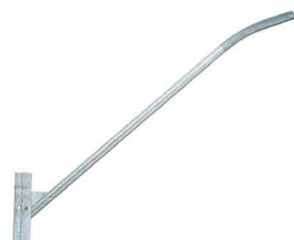
BRAÇO PARA ILUMINAÇÃO Luminaire Support Braço Luminária