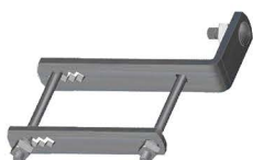
SUORTE L Cutout Mounting Bracket Soporte "L"