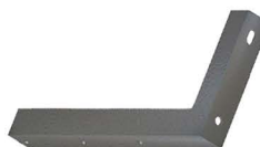
SUPOTE HORIZONTAL Horizontal Bracket Soporte Horizontal