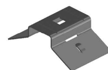
SUORTE BAP Bracket BAP Soporte BAP